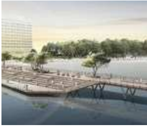
Die Seebrücke selbst ist in Anlehnung an eine Parklandschaft modelliert .

THM hat schon in der Vergangenheit mit einigen imposanten Entwürfen für Staunen in der Öffentlichkeit gesorgt. Beispielsweise der Entwurf der Seebrücke am Timmendorfer Strand oder die Entwürfe zur Bewerbung zur Olympiade, die den Umbau des Geländes am Mövenstein beinhalteten. Dort plante man seinerzeit ein Ausbildungs und Regatta Zentrum. Wer sich